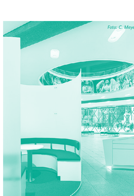
Raum für Gespräche und Beratung

donnerstags von 18.00 bis 19.30 Uhr Meditation für Übende im Sitzen und Gehen