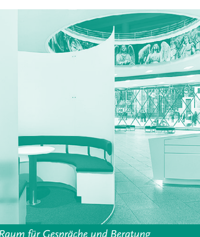
Raum für Gespräche und Beratung

Eintritt: frei, wenn nicht anders vermerkt. Über Spenden freuen wir uns sehr! Diese helfen bei der Finanzierung unserer kostenfreien Veranstaltungen.