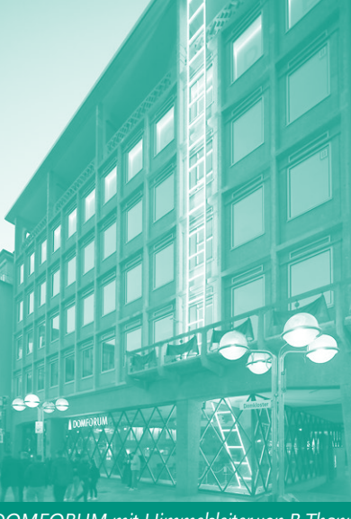
DOMFORUM mit Himmelsleiter von B. Thanner