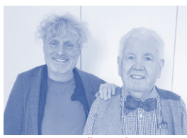
B. Knopp / P. Millowitsch

Kölns Untergrund ist voller Spuren vergangener Epochen. Tausende Objekte sind bereits ausgegraben, ebenso viele liegen noch im Boden. Seit gut 100 Jahren gibt es in Köln professionelle Bodendenkmalpflege. Sie soll sicherstellen, dass bei allen neuen Baustellen der Baugrund untersucht wird, dass Ausgrabungen planmäßig stattfinden und Funde wissenschaftlich dokumentiert werden. Doch oft geschieht archäologische Forschung unter Zeitdruck. So können häufig nur die wichtigsten Befunde aufgezeichnet werden. Organisatorisch angegliedert ist die Kölner Bodendenkmalpflege an das Römisch-Germanische Museum. Welche Möglichkeiten dort bestehen, wie viel Personal eingesetzt werden kann und wo die archäologischen Herausforderungen der kommenden Jahre liegen, wird in diesem Vortrag erläutert. Referent: Gregor Wagner M.A. , Abteilungsleiter Bodendenkmalpflege, Römisch-Germanisches Museum der Stadt Köln Veranstalter: Rheinischer Verein für Denkmalpflege und Landschaftschutz RVDL Köln