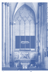
Siegerentwurf Andrea Büttner

Im August 2023 hatte das Domkapitel einen Wettbewerb für ein neues Kunstwerk für den Kölner Dom ausgeschrieben. Dieses soll im Bewusstsein der christlich-jüdischen Geschichte den Blick auf Gegenwart und Zukunft richten. Auf vier Ausstellungsstelen werden alle Beiträge innerhalb des am 20.03.2025 abgeschlossenen Wettbewerbs vorgestellt. Deutlich wird: Die Konzepte waren dabei so vielfältig wie die Biografien und künstlerischen Schwerpunkte der Teilnehmerinnen und Teilnehmer. Vorgestellt wird auch der Siegerentwurf von Andrea Büttner, der auf Wunsch des Domkapitels in der Marienkapelle des Domes in diesem Jahr umgesetzt werden soll.