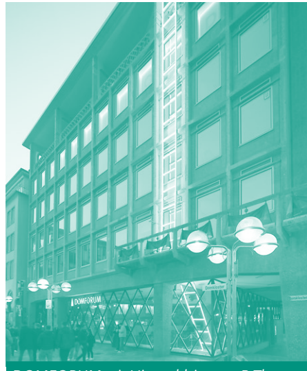
DOMFORUM mit Himmelsleiter von B.Thanner

Tickets für öffentliche Führungen sind sowohl online ( www.domfuehrungen-koeln.de ) als auch im DOMFORUM für den Rest des Monats und den nächsten Monat erhältlich.