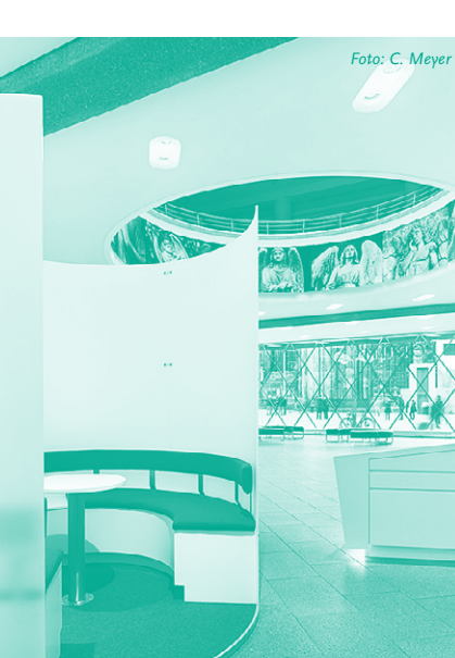
Raum für Gespräche und Beratung

Mo–Sa: 9.30–17.00 Uhr und So: 13.00–17.00 Uhr