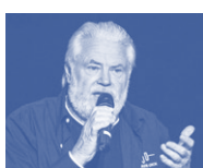
King Size Dick